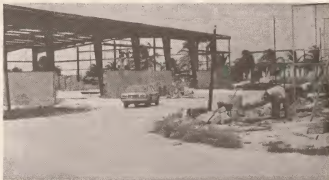
Actividad di construcion den Zona Libre

do pa habri un banco di desaroyo e aña aki pa asina stimula industria chiquito na Aruba y tambe ofrece prestamo pa traha cas.